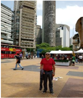
Ecce le Edifício Italia olim plus alte con 40 etages ....