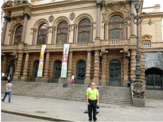
Ecce le famose Theatro Municipal.

UBI - UNION BRASILIAN pro INTERLINGUA União Brasileira pró Interlíngua Condomínio Serra Azul, Quadra 22, Casa 11 [Bairro: SMS] 73070-045 (Sobradinho) Brasília - DF, BRASIL. www.interlingua.org.br ; presidente@interlingua.org.br