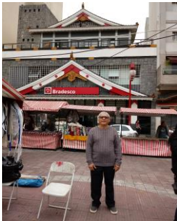
Quartiero nipponic Liberdade - colonia japonese