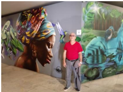
Exposition in le Memorial del America Latin